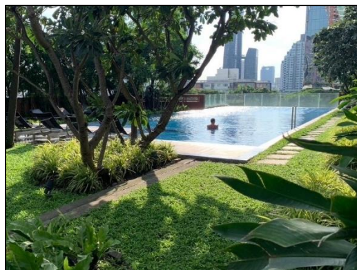
ภาพที่ 1.6-1 สถานภาพโครงการในปัจจุบัน